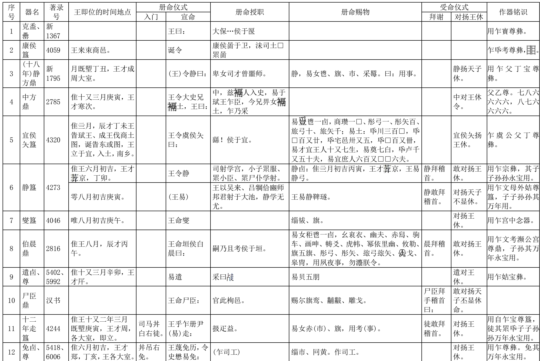
表六、西周王册命铭文分析表